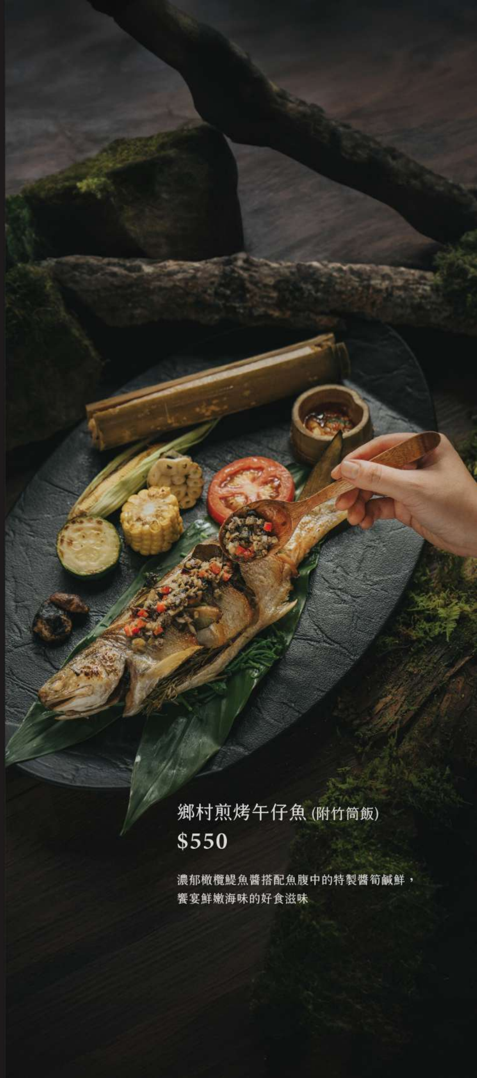
鄉村煎烤午仔魚 (附竹筒飯)